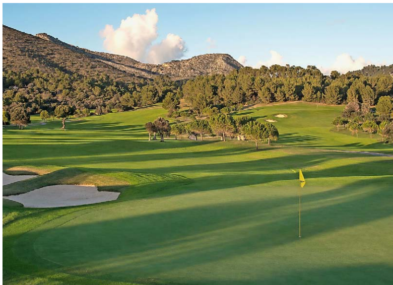
NATURAL BEAUTY Die Anlage von Alcanada befindet sich in wunderschöner Landschaft.