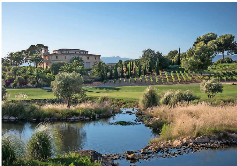
WAHRZEICHEN Das Herrenhaus von Son Gual überwacht das Fairway von Loch 18.