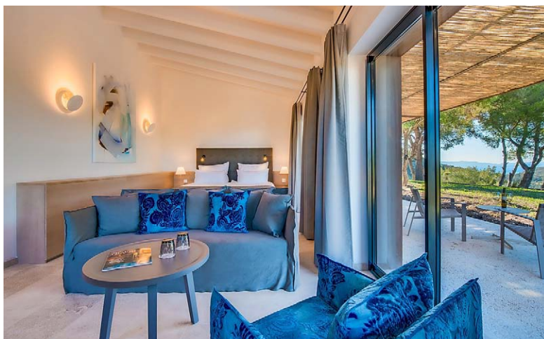
WOHLFÜHLAMBIENTE Die Suiten bestehen durch eine geschmackvolle Einrichtung.