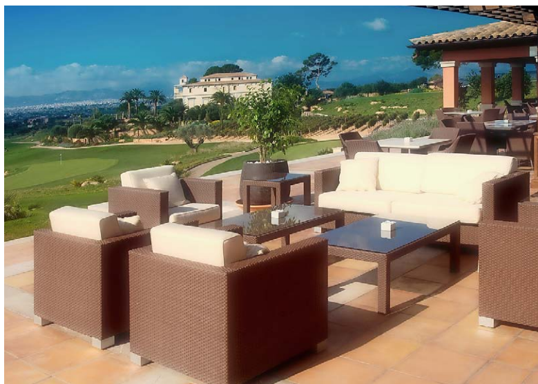
KÖSTLICH Im Clubrestaurant werden Golfer rund um die Uhr verwöhnt.

der wirklich schön gestalteten Kombination von sanften Hügeln mit hübschen Olivenbäumen, perfekt gepflegten Fairways und Greens sowie den sehr natürlich wirkenden und über das ganze Areal gut verteilten Wasserhindernissen. Im anderen Moment verflucht man die zahlreichen Sandbunker, welche die Greens verteidigen, ärgert sich über die teils sehr wellig angelegten Greens, die präzise Pitches verlangen.