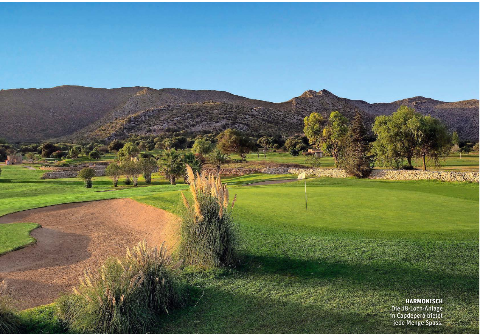
HARMONISCH Die 18-Loch-Anlage in Capdepera bietet jede Menge Spass.

sich das, was man sich unter einem Finca-Urlaub – also unter Ferien auf einem Landgut – nur so erträumen kann.