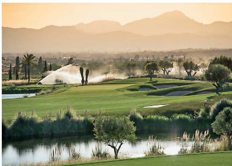
ÖKOLOGISCH Das Wasser auf Son Gual stammt aus der clubeigenen Kläranlage.

einem kompakten Bag bereitgestellten Schläger stehen entweder am clubstohire-Schalter in der Ankunftshalle des Flughafens Palma bereit, oder sie werden gegen Aufpreis in das angegebene Hotel geliefert. Ein weiterer Vorteil: Meldet man den Mietwunsch frühzeitig an, kann man sogar die Gelegenheit nutzen, beim Golfspiel auf Mallorca genau die Schläger auszutesten, die man zukünftig kaufen will. www.clubstohire.com