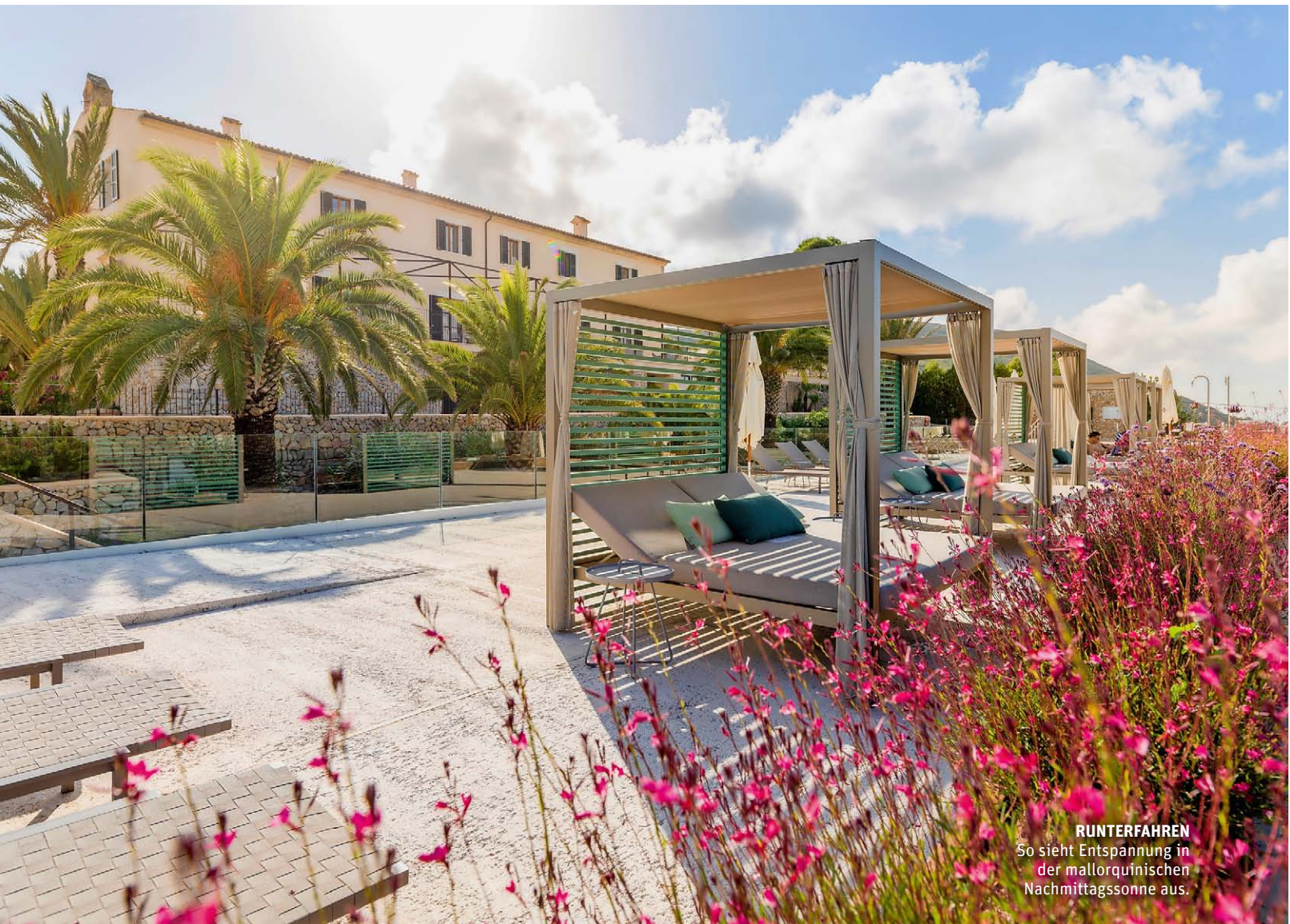
RUNTERFAHREN So sieht Entspannung in der mallorquinischen Nachmittagssonne aus.