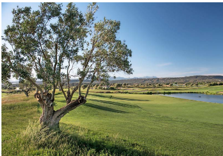
OLIVENBÄUME Über 800 teils uralte Olivenbäume zieren den Kurs von Son Gual.