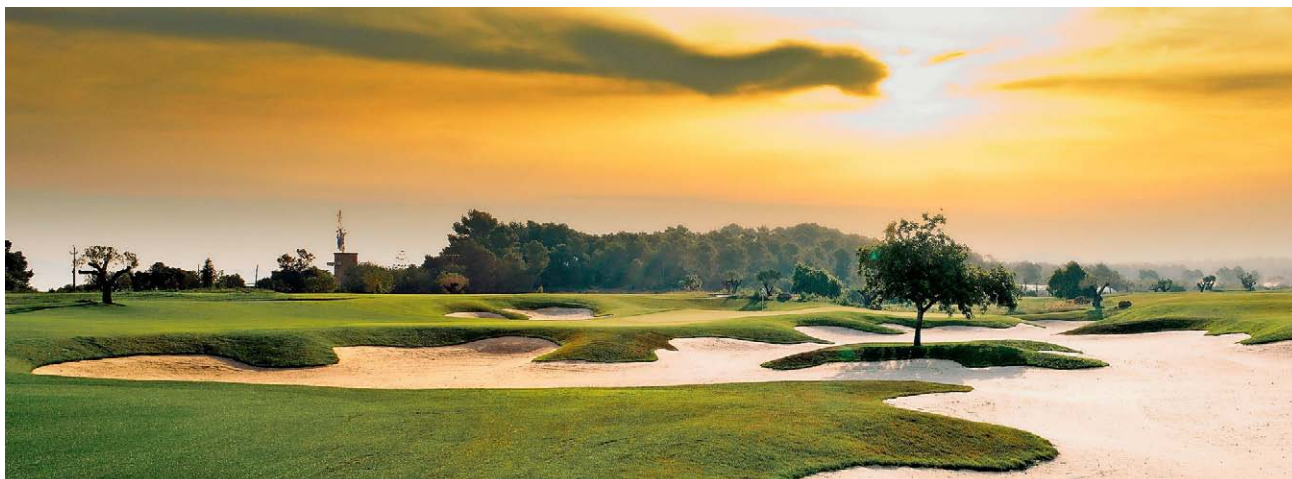
SANDY LANE Einzigartig ist der rund 150 Meter lange Sandbunker auf der dritten Spielbahn, welcher als grösster Europas gilt.

und Golf Son Gual öffnete erstmals seine Tore.