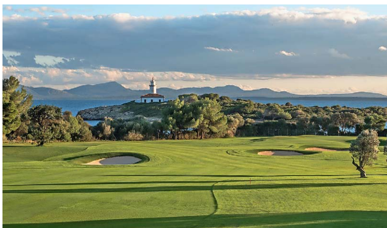
GOLF-WAHRZEICHEN Der imposante und legendäre Leuchtturm von Alcanada.